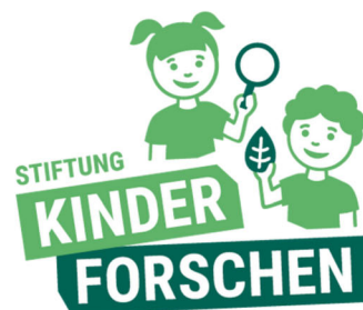
Dachmarkenlogo mit und ohne Claim