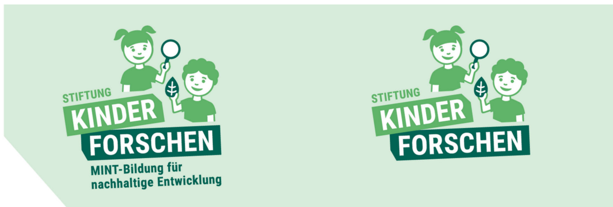
Dachmarkenlogo auf hellem Hintergrund