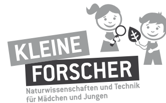
Version in Graustufen