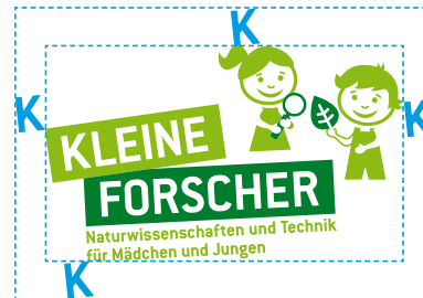
Schutzzone (Abb. 1)