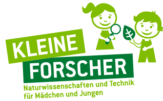
2C-Version – Coated (Sonderfarbe Hellgrün und Mittelgrün)