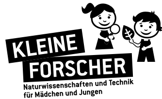
Version in Schwarz