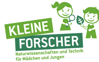
2C-Version – Uncoated (Sonderfarbe Hellgrün und Mittelgrün)